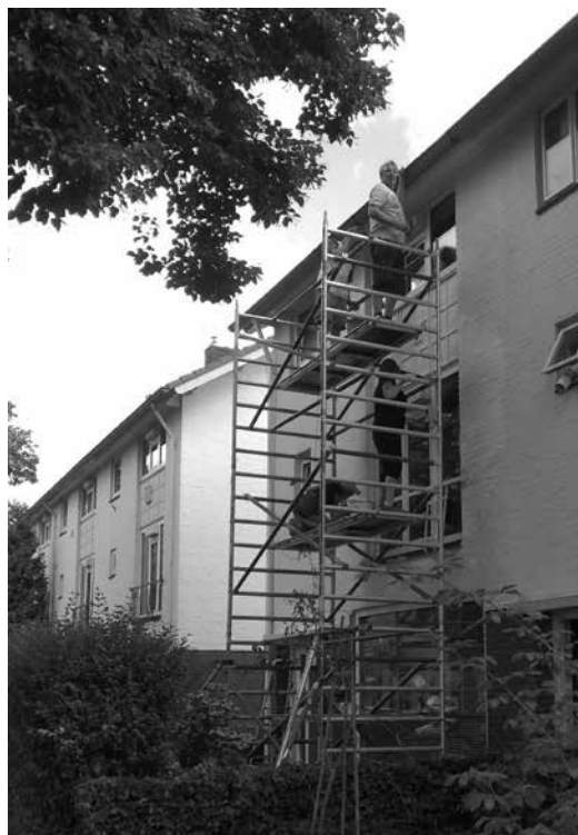
Vier bewoners aan het schilderen in de Piuslaan

Liebregts verwacht in september 2016 klaar te zijn met het schilderwerk. De meeste bewoners die zelf schilderen zullen dan ook wel klaar zijn. Dan zal het wijkbestuur de balans op maken en achterblijvers aan gaan spreken. Eén van die achterblijvers is in ieder geval Woningcorporatie Trudo. Zij heeft nog 6 woningen in onze wijk en wil niet meedoen met het project. Het wijkbestuur beraadt zich nog over stappen richting Trudo. Eén mogelijkheid die wordt overwogen is dat wij de publiciteit gaan zoeken over de houding van Trudo.