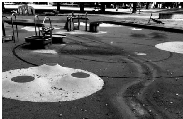
Roestige baan rechts in de afgesloten waterspeelplaats

De drie toestellen zijn grotendeels gemaakt van roestvast staal en hier en daar wat hout. Door aan een wiel te draaien komt er door middel van een kraan water uit het toestel, dat vervolgens via een goot naar twee bakken stroomt, waar het water wegloopt over de vloer