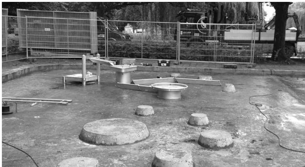
De werkzaamheden op 14 juni j.l.

Ik ben al eens gaan kijken tijdens de bouwwerkzaamheden op 14 juni 2016 en toen moest er nog veel gedaan worden.