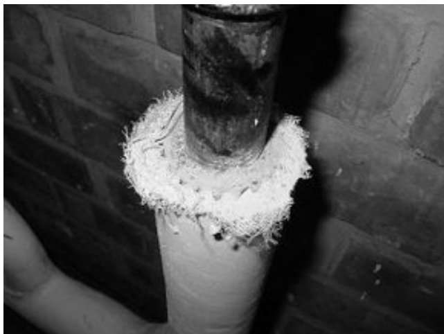
Niet-hechtgebonden asbest als isolatiemateriaal

Of er nu een meldingsplicht geldt of een vergunningplicht, het asbest moet ook nog door iemand verwijderd worden. Bij mij is onduidelijk of het nu formeel is toegestaan om dit zelf te doen en zo ja, voor welke situaties dat dan geldt. De informatie hierover op de website van het ministerie van VROM laat ruimte om te veronderstellen dat in geval van een meldingsplicht een particulier de werkzaamheden