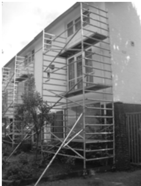
Foto van het vorige schilderproject.