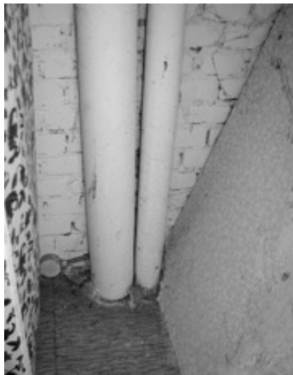
Asbestleidingen zoals in huizen voorkomt

Overige toepassingen van asbest in onze woningen, bijvoorbeeld als isolatiemateriaal of vochtwering, zijn bij mij niet bekend. Bij het vervangen van de stalen kozijnen in onze eigen woning aan de Piuslaan zijn we geen asbesthoudende materialen tegengekomen. Dit wil echter niet zeggen dat u er automatisch vanuit kunt gaan dat er in uw woning geen asbest is verwerkt. Bij renovaties of verbouwingen die tot de jaren tachtig in eigen beheer zijn uitgevoerd kan asbest zijn toegepast, zonder dat iemand daarvan nu nog op de hoogte is. Als de woning al langere tijd particulier eigendom is, kan de situatie per woning bovendien sterk verschillen.