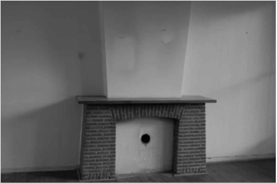
De schouw waar in het begin de kolenkachel heeft gestaan.