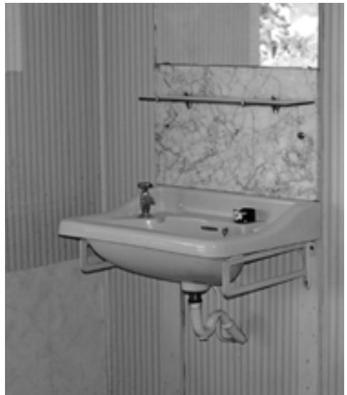
Wastafel in de slaapkamers met marmere en alleen koud water.