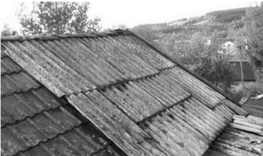
Asbest golfplaten als dakbedekking.

onder vinylvloeren werd vroeger soms een asbestviltlaag aangebracht.