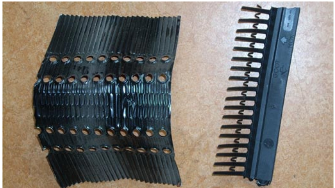
Links de folie voor onder de vorsten en rechts het anti-vogelgaas.

De vorsten (dit zijn de pannen bovenop de nok) zijn bij onze huizen in de cement gezet. Na verwijdering waren deze dus niet meer opnieuw te gebruiken. Deze heb ik dus vervangen door nieuwe (vast geschroefde)