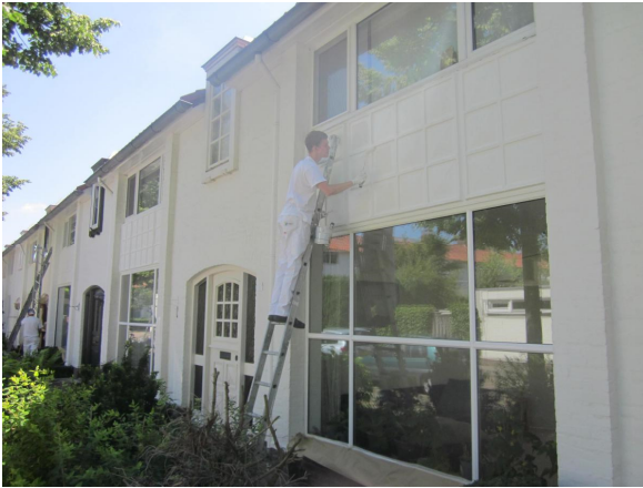
behandeling van betonnen panelen